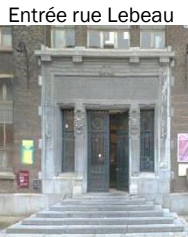
Sur google maps : centre universitaire Zénobe Gramme